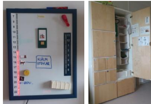
Tankestöd kan se ut på olika sätt.

Vi besöker StoCKK som har en lägenhet utrustad med pedagogiska anpassningar och produkter. Här kan du få tips och idéer om tankestöd i en vardagsmiljö. Utifrån kunskap om ASD och barnets/ungdomens motivation diskuterar vi hur man kan ordna så att barnet lättare klarar mer hemma.